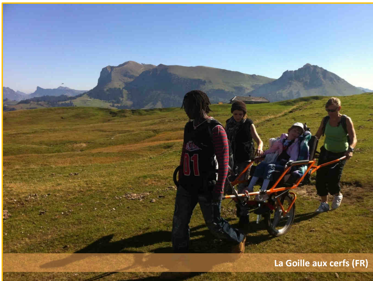
La Goille aux cerfs (FR)