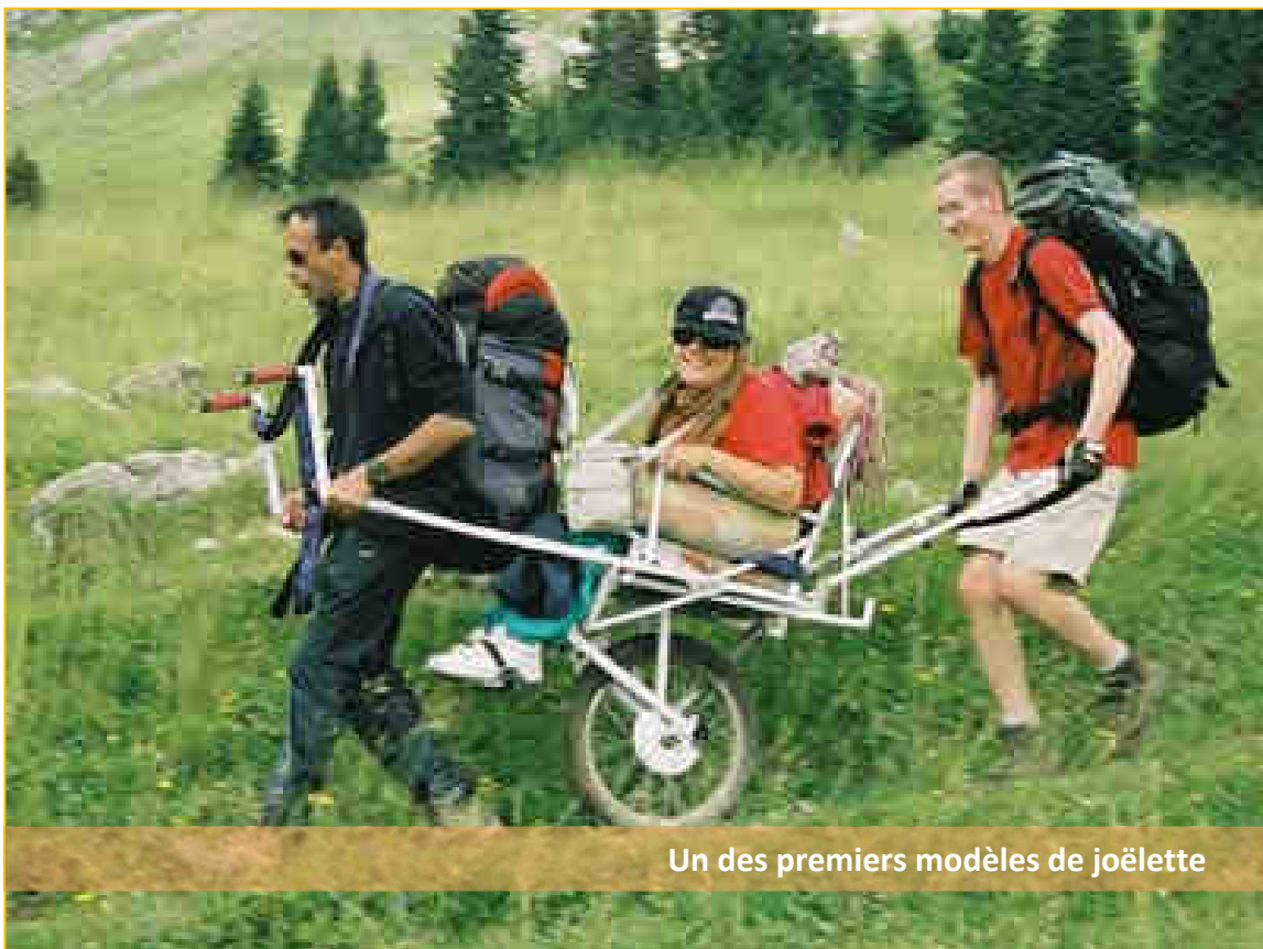
Un des premiers modèles de joëlette