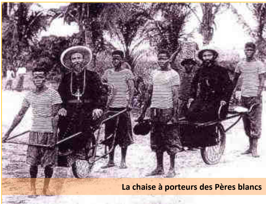
La chaise à porteurs des Pères blancs