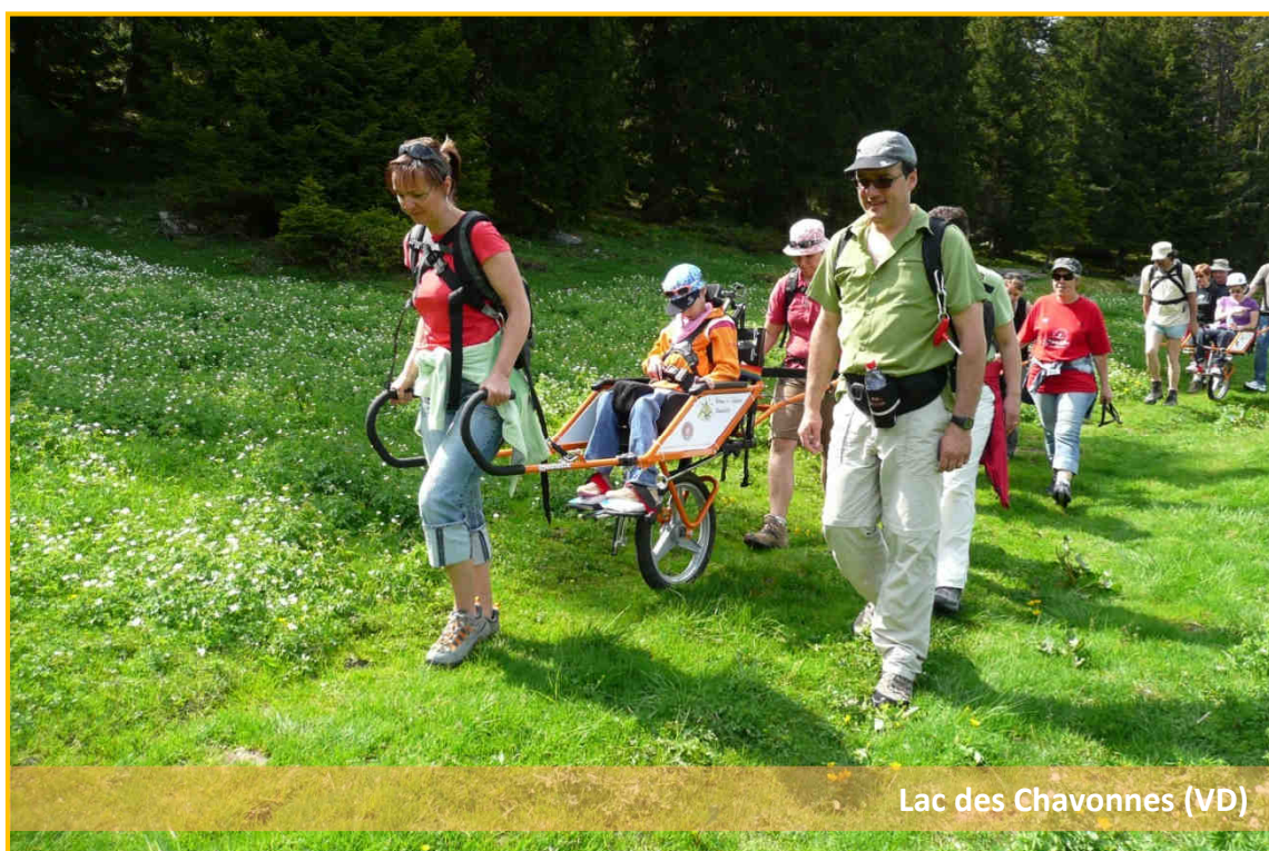
Lac des Chavonnes (VD)

Dès 2015, plusieurs fois par ans, nous allons organiser des randonnées spécifiques afin que les familles puissent découvrir les joies de la randonnée pour une famille unie. La randonnée sera organisée intégralement par un accompagnateur en montagne spécialement sensibilisé au problème du handicap. Il prendra à sa charge la reconnaissance du parcours, l'organisation de la journée, la confection du pic-nic, la formation des bénévoles et l'animation le long du parcours.